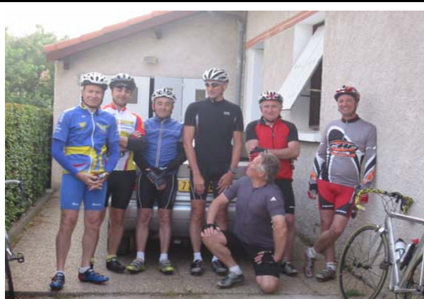
Le groupe exceptionnel du Samedi matin c'est 100 kilomètres en 4 heures et à l'arrivée un très solide "apéro"