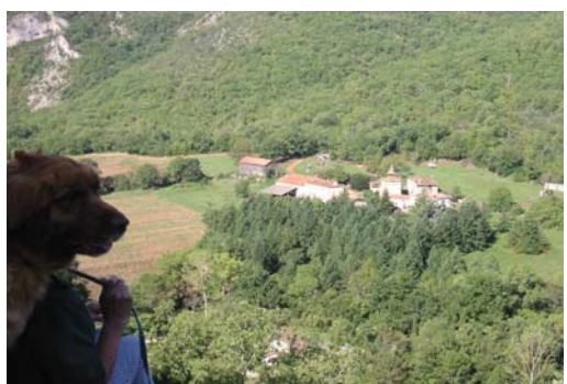
La Corniche à Brousses les Antibels (StAntonin)