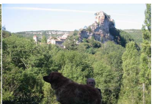
Penne le Village et vestiges du château