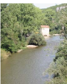
L'Aveyron à Cazals