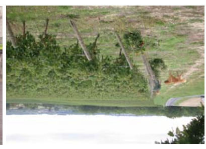
Cahuzac/Vère- le vignoble gaillacois