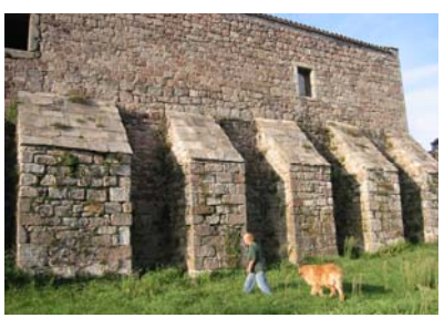
Vaour - Commanderie XI ème siècle