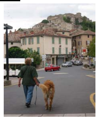
Cordes sur ciel