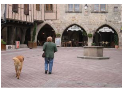
Castelnaud de Montmirail La place aux arcades

KMS 110 Difficulté **** EN VELO 5 heures EN VOITURE : 2 heures pour CORDES