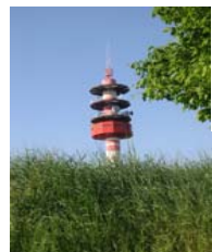
tour du fau