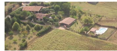
Départ à pieds du gîte

En partant du gîte, prévoir 1 heure de marche avec une bonne paire de chaussure ou "idéal" des bottes (recommandé et indispensable au printemps ou en automne), et pantalon. En été, possibilité de manches courtes et de pique-nique en forêt (calme et solitude assurés) Le parcours n'est pas balisé, on ne pénètre dans aucune ferme ni habitation. Il s'effectue pour partie dans les prairies et dans la forêt